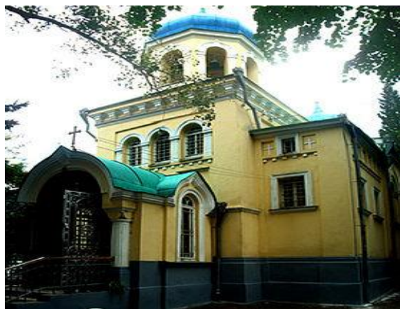
Храм св.Александър Невски