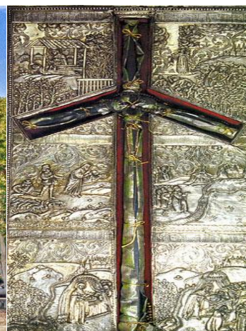
Кръст на св.Нина