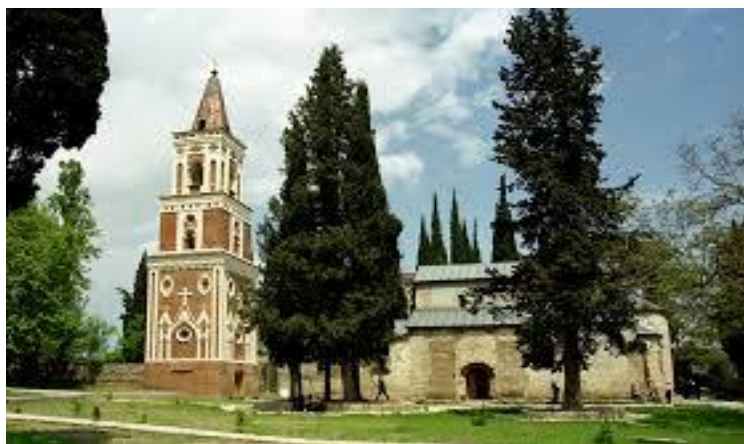
Манастир св.Давид Гареджи

Най-голямата светиня в обителта са мощите на св. равноапостолна Нина, където са се случили много чудеса и знамения. Отпътуване за Кварели.Настаняване в хотел в града.Вечеря.