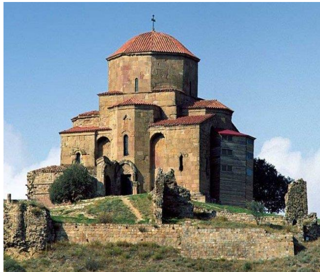
Манастир св.Шио Мгвински